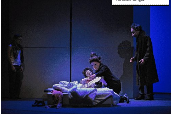
Im Spiel mit Masken gibt die Theatergruppe „Familie Flöz“ dem Schicksal flüchtender Menschen ein Gesicht.